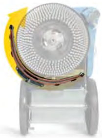
Rotazione del tergipavimento parabolico

L'associazione tra il motore di aspirazione ed il tergipavimento garantisce ottimi risultati di asciugatura.