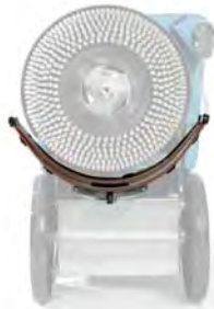
Posizione tergipavimento parabolico a riposo