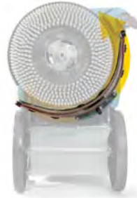
Rotazione nell'altro senso del tergipavimento parabolico